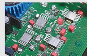
模拟放大部分的放大管全部用金属壳遮挡起来